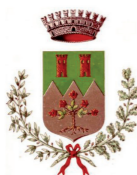
Comune di Ravascletto