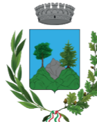
Comune di Treppo Ligosullo

Fotografia dello sfondo: Marlino Peresson - Promosio, luglio 1963 stampa Tipografia C. Cortolazzi | Paluzza