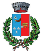
Comune di Arta Terme