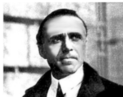
Giacomo Matteotti , deputato (Frattra Polesine 1885 - Roma 1924)

Il parlamentare socialista fu assassinato per aver denunciato brogli elettorali e corruzione nell'amministrazione pubblica da parte del fascismo nascente; Mussolini di quella vicenda si assunse la "responsabilità politica, morale e storica" di fronte ad un Parlamento in cui le forze democratiche erano ormai divise e disorientante di fronte all'avanzare del fascismo.