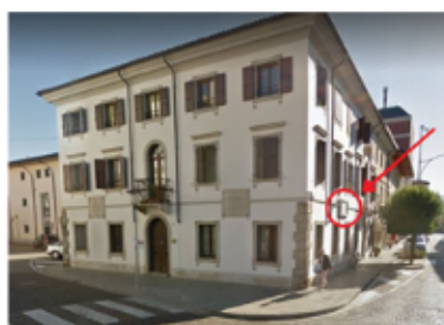
L'ex municipio , oggi sede degli uffici Istruzione, Cultura e Turismo del comune di Codroipo - Nel cerchio rosso dove è posizionata la lapide

La decisione di porre questa lapide su una facciata del Municipio fu uno dei primi atti dell'Amministrazione comunale di Codroipo, liberata il primo maggio 1945, quando il Comitato di Liberazione Nazionale di Codroipo , composto da rappresentanti di tutti i partiti antifascisti, assunse provvisoriamente il governo della Città in attesa di nuove elezioni democratiche dopo vent'anni di dittatura.