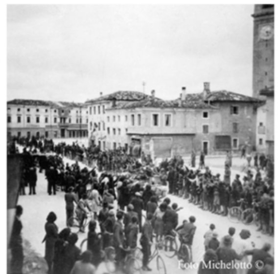
La Liberazione di Codroipo 1 maggio 1945, Piazza Garibaldi