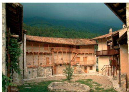
Museo di Berginj

Il percorso della Camminata Redelonghi si svolge dal paese di Zapotocco (IT) al paese di Bergogna (SLO). La durata del percorso a piedi è di circa 5 ore con modesti dislivelli (Bocche di Pradolino 550 m. e M. Brdo m.909). Il percorso prevede delle soste a Podbela (presso il monumento ai caduti nella guerra di Liberazione), nel cimitero di Sedlo dove è sepolto Marco Redelonghi e al monumento (presso il M.Brdo) dove è caduto Redelonghi. Seguirà un incontro conviviale presso il museo di Berginj, un complesso di case di pietra a due piani intrecciate con ganki, è un monumento etnologico e di architettura. Vi aspettiamo numerosi!