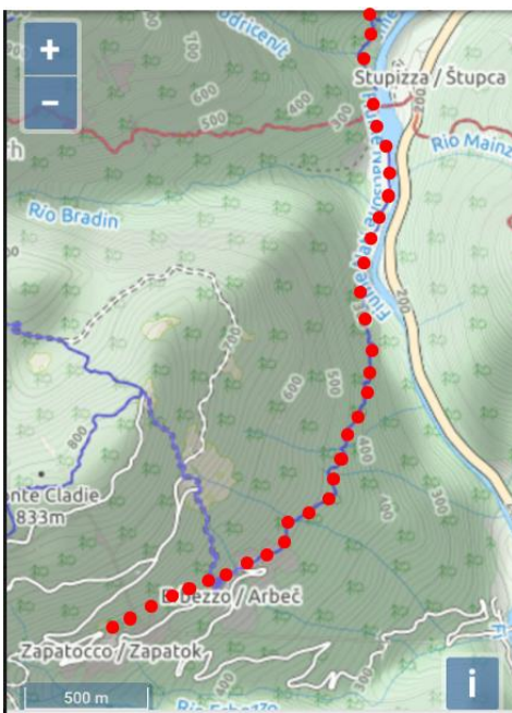
Zapatok/Štupca – Zapotocco/Stupizza